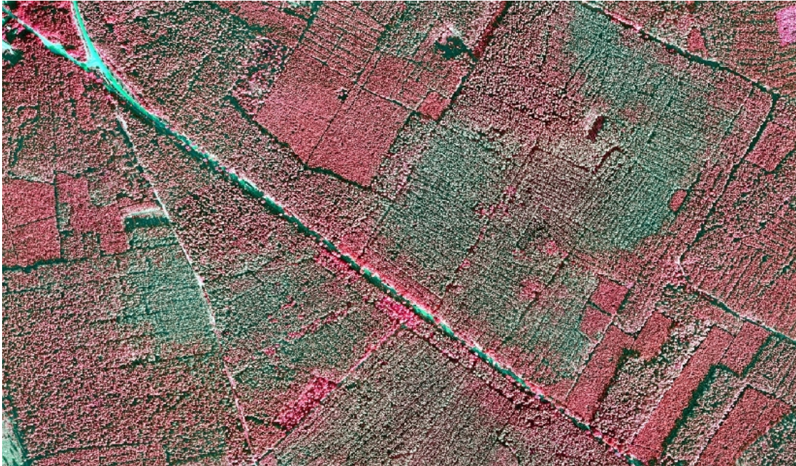
Abb.1: Luftbild vom Oktober 2009 aus dem nördlichen Sachsen-Anhalt. Der Fraß der Kiefernbuschhornblattwespe ist an der grünlichen Verfärbung der Kiefernkronen zu erkennen, gesunde Kiefern sind im Infrarot-Falschfarbenfoto rot.

Sobald die Auswertung der Luftbilder abgeschlossen ist, werden die betroffenen Forstdienststellen über das weitere Vorgehen, z.B. Vorschläge zur lokalen Verdichtung der Winterbodensuchflächen, informiert.