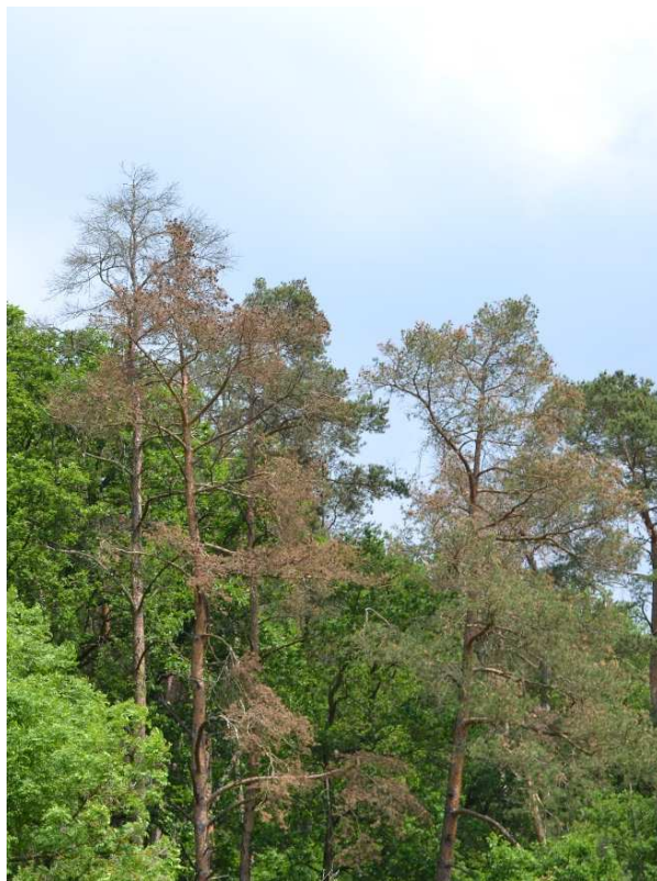
Abb. 1: Schadbild in einem Mischwaldbestand in südwestlicher Hanglage, mit einzelnen abgestorbenen Kiefern infolge des Diplodia -Triebsterbens, ausgelöst durch Sphaeropsis sapinea

Das Diplodia -Triebsterben ist eine weltweit verbreitete Erkrankung bei Kiefern aller Altersstufen, die auch an anderen Nadelbäumen wie z. B. Douglasien auftreten kann. Sie wird durch den wärmeliebenden Mikropilz Sphaeropsis sapinea (Synonym: Diplodia pinea ) ausgelöst. Die Erkrankung tritt seit einigen Jahren in Kiefernbeständen der Trägerländer der NW-FVA auf. Im Frühjahr 2017 wurden auffällige bis wirtschaftlich fühlbare Schäden bei Waldkiefer infolge des Diplodia -Triebsterbens in Hessen und Sachsen-Anhalt beobachtet.