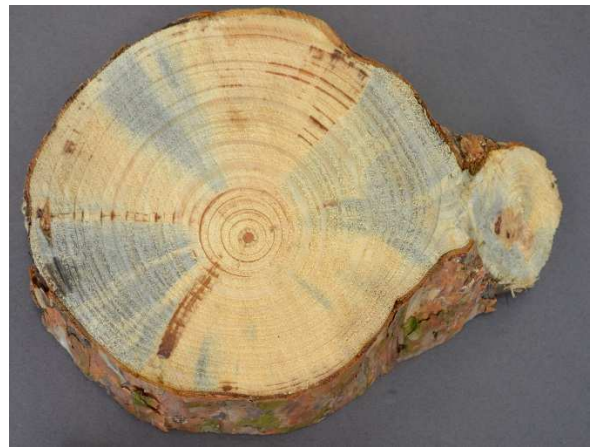
Abb. 6: Stammscheibe einer Waldkiefer, Holzbläue infolge des Befalls mit S. sapinea