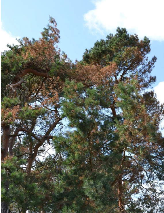
Abb. 3: Waldkiefern mit Diplodia -Triebsterben ausgelöst durch Sphaeropsis sapinea