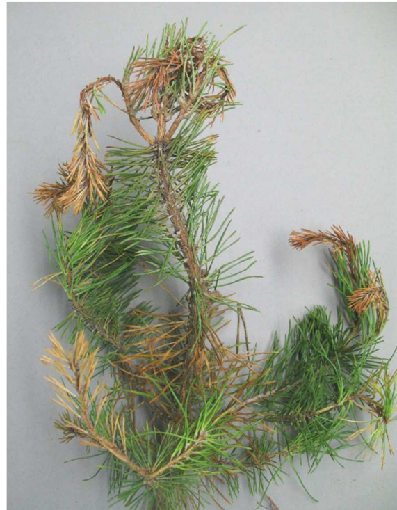
Abb. 4: Zweig einer Jungpflanze von Waldkiefer, Triebverkrümmung und -sterben infolge des Befalls mit S. sapinea