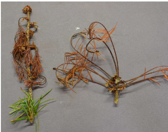
Abb. 5: Zweig einer Jungpflanze von Douglasie, Triebverkrümmung und -sterben infolge des Befalls mit S. sapinea