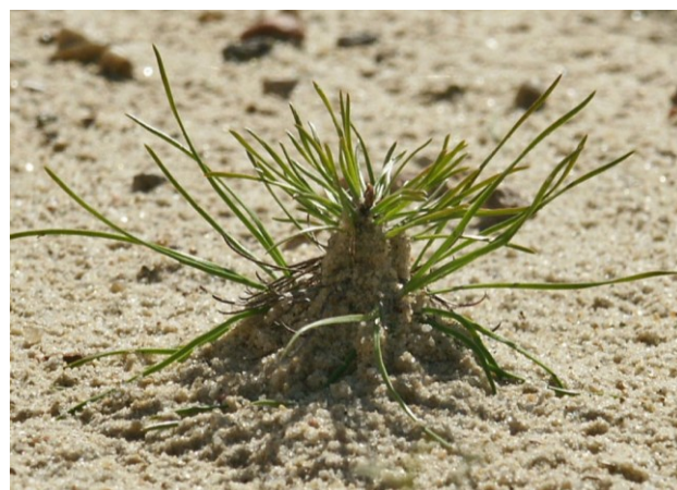
Abb. 4: Ein Kiefersämling kämpft sich durch den Sand

Die Bestände haben sich zunächst vornehmlich mit Kiefer verjüngt und diese Pflanzen sind zu einer großen Zahl bereits in die höchsten Verjüngungshöhenklassen oder in den Derbholzbestand eingewachsen. Allerdings scheint diese Pionierphase abgeschlossen (auch bei Birke ist ein deutlicher Rückgang neuer Verjüngung zu verzeichnen). Die verbesserten Bodenbedingungen begünstigen zunehmend die Ansamung von