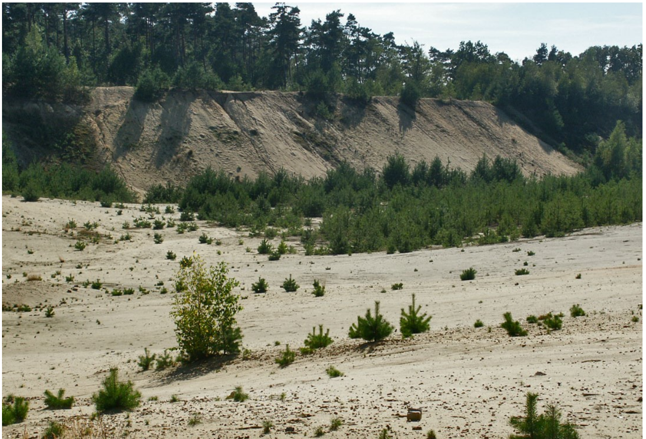
Abb. 2: Pionierwaldentwicklung auf einer Sandabbaufläche im Naturwald Schmidts Kiefern