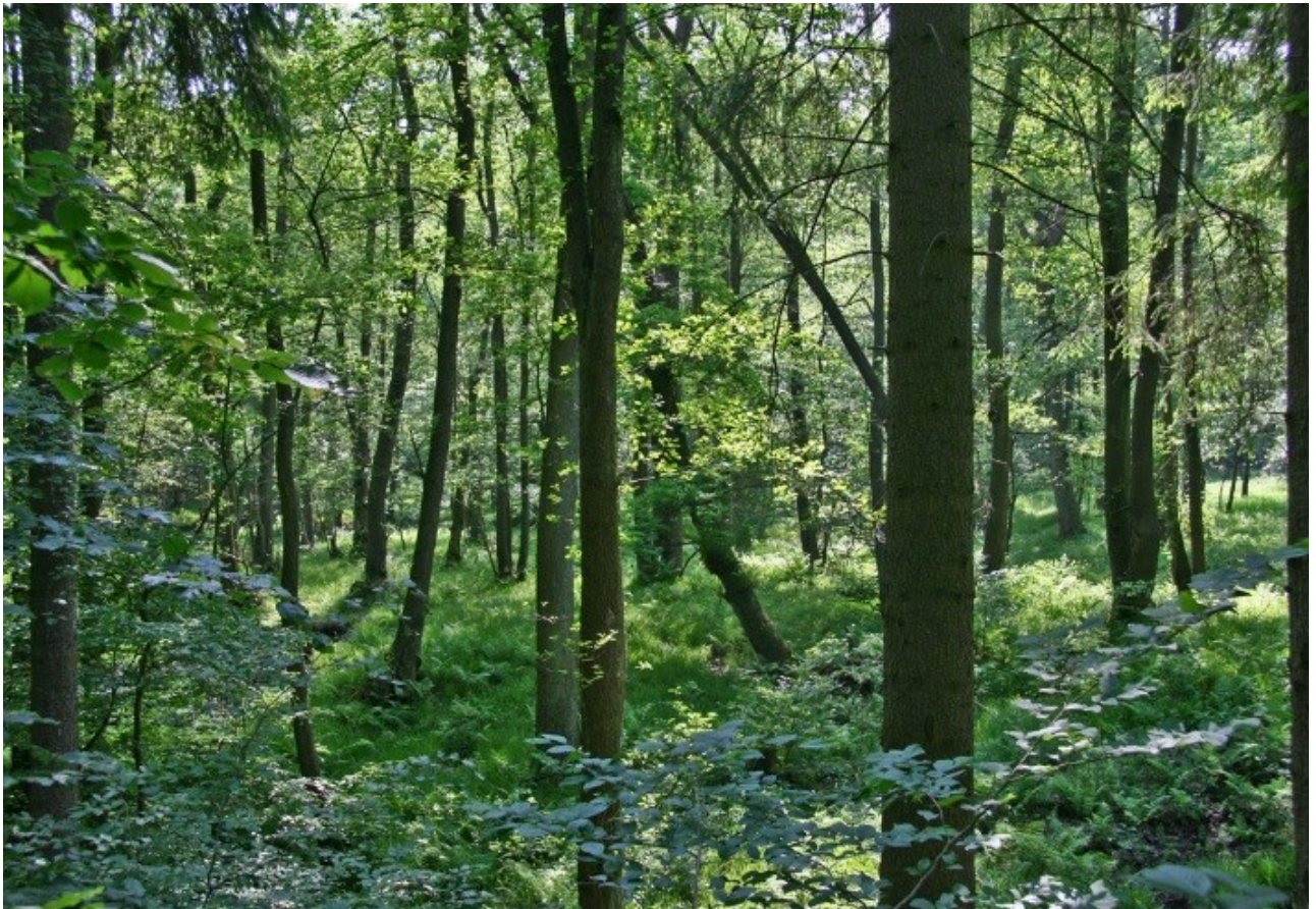
Abb. 2: Erlenbruchwald im Naturwald Hagental