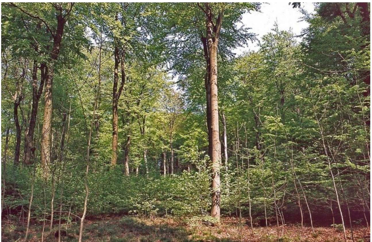
Abb. 2: Buchenaltholz im Naturwald Luhdener Klippen