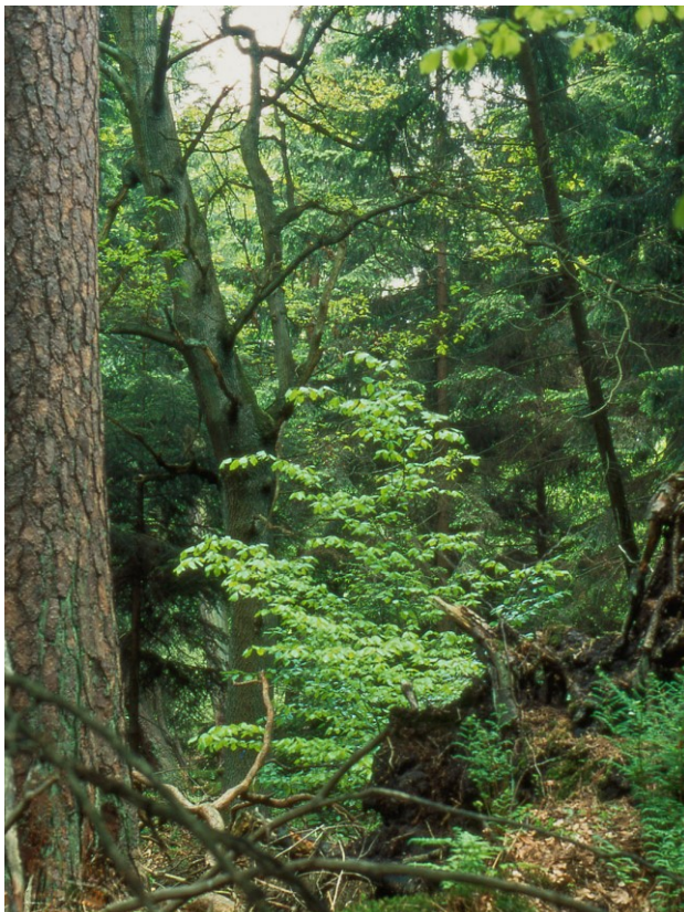
Abb. 2: Kiefernaltholz im Naturwald Kiekenbruch