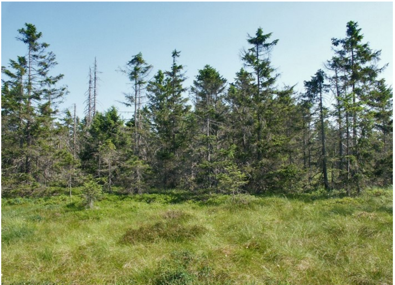
Abb. 2: Moorfichtenwald der Harzhochlagen