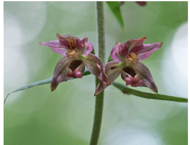
Abb. 4: Breitblättrige Sitter

Roten Liste Niedersachsens und Bremens als gefährdet gelten. Hinzu kommen insgesamt 4 Arten, die, wie die Breitblättrige Sitter (Abb. 4) oder die Wasserfeder, dem besonderen Schutz der Bundesartenschutzverordnung unterliegen. Sie betont, dass die auch im Naturwald vertretenen Traubenkirschen-Erlen-Eschenwälder und die Bruchwaldreste die wertvollsten Teile des Naturschutzgebietes darstellen.