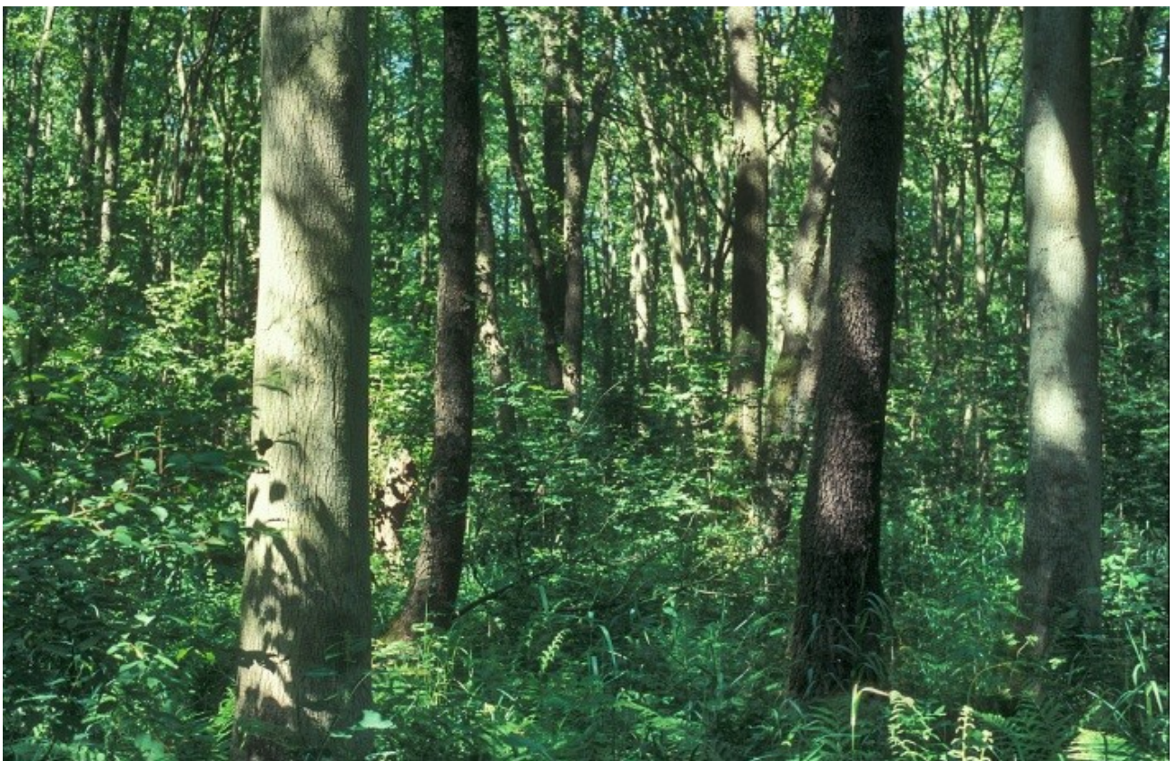
Abb. 2: Traubenkirschen-Erlen-Eschenwald im Naturwald Bennerstedt