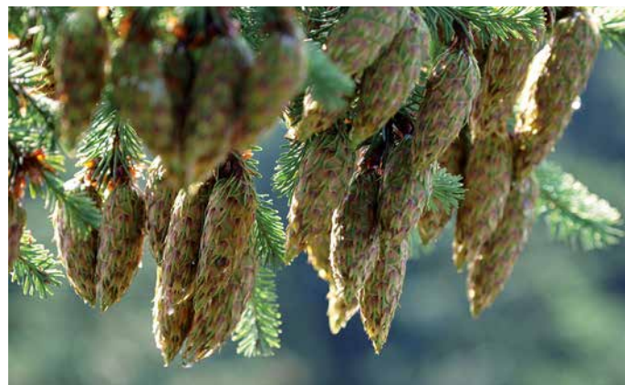
Zapfen der Douglasie

Bislang wird Vermehrungsgut der Douglasie größtenteils in zugelassenen Saatguterntebeständen (SEB) gewonnen. Deren behördliche Zulassung verlangt bestimmte, gesetzlich vorgeschriebene Mindestkriterien: Neben Formeigenschaften und Vitalität müssen SEB aus fruktifikationsfähigen Bäumen bestehen, die so zahlreich und gut verteilt sind, dass zwischen den Bäumen eine ausreichende gegenseitige Befruchtung gewährleistet ist. Vorgeschrieben sind mindestens 40 Bäume mit einem Mindestalter von 60 Jahren. Schon die Einhaltung dieser Minimalvorgaben engt die Verfügbarkeit