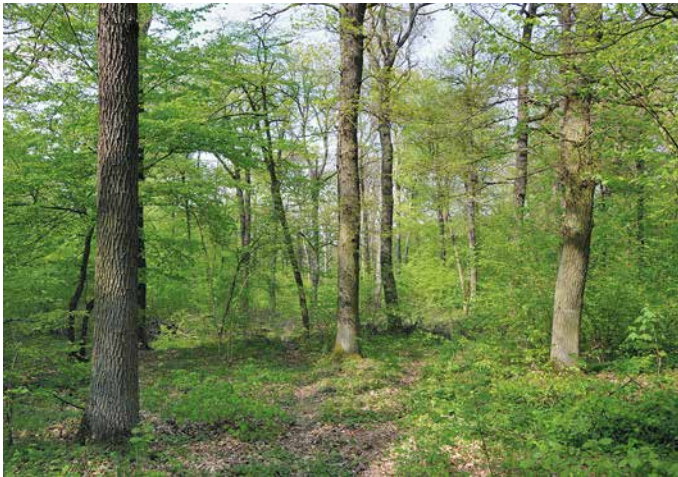
Durchgewachsener Mittelwald mit Stieleiche im Oberholz, FFH-Gebiet „Hakel südlich Kroppenstedt“, Landkreis Börde, Harz und Salzlandkreis.

sind und jeweils einem Nutzungszyklus von 20 bis 30 Jahren unterliegen. Dabei wird die Hauschicht des jeweiligen Schlags bis auf wenige sogenannte Lassreitell, die das zukünftige Oberholz bilden sollen, vollständig geerntet. Je nach Bedarf und Verfügbarkeit werden auch einzelne Stämme aus dem Oberholz entnommen. Dementsprechend ist der Mittelwald eine multifunktionale Betriebsart, die verschiedenste Ansprüche von der Brennholzgewinnung über die Bauholzerzeugung bis hin zur Waldweide erfüllt (Cotta 1832, Groß u. Konold 2010, Vollmuth 2021). Dadurch entsteht ein kleinräumiges Mosaik unterschiedlicher Sukzessionsstadien und Baumalter auf engem Raum, die sich durch ein verschiedenartiges Licht- und Wärmeangebot in Bodennähe auszeichnen. Typische Baumarten des Oberholzes sind Stiel- und Trauben-Eiche, aber auch Buche und Edellaubhölzer; das Unterholz wird wie im Niederwald von ausschlagfähigen Baumarten wie Hainbuche, Winter- oder Sommer-Linde und zahlreichen Straucharten gebildet; hier sind etwa Feld-Ahorn, Weißdorn und Hasel zu nennen (Schröder 2009, Vollmuth 2021).